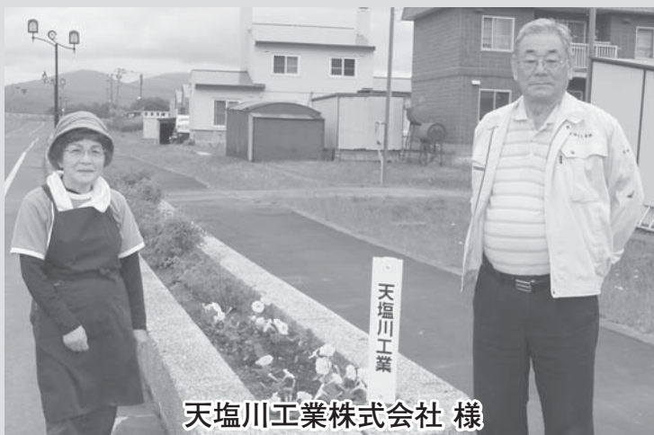
天塩川工業株式会社 様