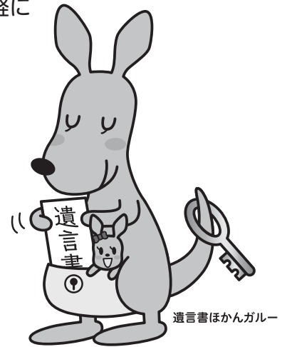
遺言書ほかんガルー