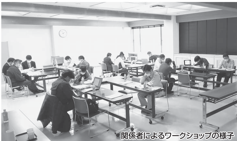
関係者によるワークショップの様子