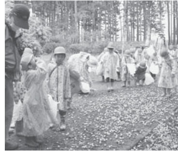
スモモがいっぱい落ちてる

今はちょうどスモモのシーズン。道にはたくさんスモモが落ちていました。でも、下に落ちていたスモモはしっかりと洗わないと食べられません。なぜかというところ、林業試験場にはいろいろな野生動物がおり、そのフンに触れてしまっているかもしれないから。特に気をつけないといけないのは「キツネ」。寄生虫がいて、エキノコックスになってしまう可能性があります。そのため、木を揺らして落ちてきた実を直接袋でキャッチすることになりました。大量の水滴や死角からのスモモ攻撃にも負けず、清潔な実をキャッチできたかな?