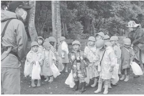
かっぱをきこんで準備万端!!

今回は小雨がぱらつく中でしたが、こどもたちは夏の木々や生き物を観察したり、森の実りを味わったりと、意欲的に活動していました。