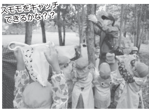
スモモをキャッチできるかな??

今はちょうどスモモのシーズン。道にはたくさんスモモが落ちていました。でも、下に落ちていたスモモはしっかりと洗わないと食べられません。なぜかというところ、林業試験場にはいろいろな野生動物がおり、そのフンに触れてしまっているかもしれないから。特に気をつけないといけないのは「キツネ」。寄生虫がいて、エキノコックスになってしまう可能性があります。そのため、木を揺らして落ちてきた実を直接袋でキャッチすることになりました。大量の水滴や死角からのスモモ攻撃にも負けず、清潔な実をキャッチできたかな?