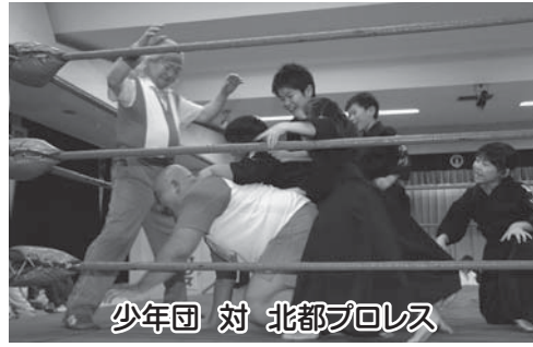
少年団 対 北都プロレス