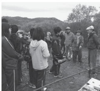
中川中学校1年生とポンピラ塾の皆さんが見学に訪れました。