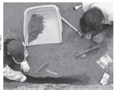
獣骨が出土したときの様子。脆いために慎重に発掘作業が進められました。

試掘調査は、表土を重機で剥ぎ取った後、手掘りで進められました。陶器の欠片や炭などポツポツと始まった調査3日目、天塩川左岸の調査区から、ついに明らかに「古い」時代の黒曜石製の石器や土器片が出土し、歓声があがりました。慎重に掘り進めていくと、その周囲から黒曜石製の石器、続いて獣骨が出土しました。隣の試掘場所からは、大量のカワシンジュガイ、そして