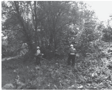
地形を把握するため、まずは草刈りです。

今回調査したのは安部志内川右岸遺跡といい、国道40号線にかかる安平志内橋付近の安平志内川右岸に位置します。遺跡の名前のもとになったのは安平志内川ですが、遺跡の名前には安部志内川と違う漢字が当てられています。いずれにしても、アベシナイはアイヌ語の「ア・ペシ・ナイ 我々・沿って下る・川」から由来します。