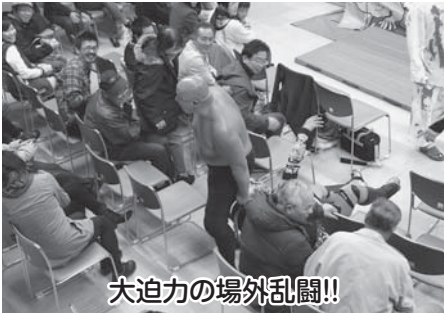
大迫力の場外乱闘!!