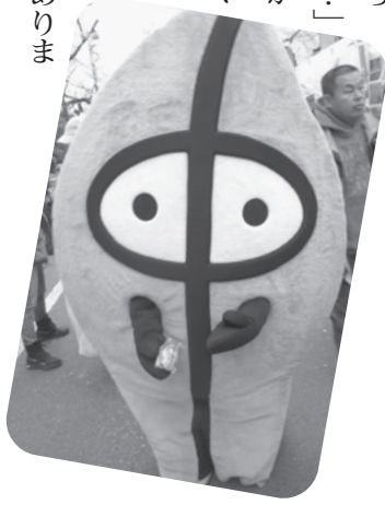
じゅえるストラップを持ったじゅえる

「これは北海道産？ スーパーには外国産のとうもろこしがほとんどだから…」と尋ねてくるお客さんがいました。私が知っている限りでは、北海道のスーパーに外国産のとうもろこしが並んでいるところを見たことがありません。