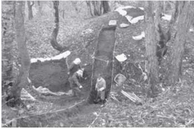
火山灰層が見つかった壕の試掘の様子 (人が立っている場所が壕の断面)

チャシ跡の頂上部直下の壕の底付近で、白色の火山灰層が発見されました。この火山灰は、北海道埋蔵文化財センターの専門家のもとで分析され、構成鉱物、火山ガラスの形態・化学組成などから、1739年の