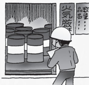
危険物の安全管理

危険物は、一度火災になると容易に延焼し消火困難となるため、この機会に各家庭に設置しているホームタンクなどの維持管理として次の事項の点検にご協力をお願いします。