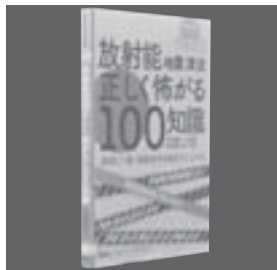
「放射能地震津波 正しく怖がる100知識」 沼田恵昭ほか 監修

仕事も、家も、家族までも失った男が、南にある生まれ故郷を目指して旅に出た。その旅のパートナーとして男が選んだのは、愛犬のハッピー。一人と一匹の旅の結末は……。同名のコミックも中川町の図書室に所蔵しています。