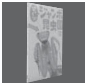
児童書 「びっくりに! ジャンボ昆虫園」 岡島秀治 監修

放射能・地震・津波から家族を守る安全安心生活マニュアル。放射能災害から身を守る方法、耐久節電生活を乗り切る知恵とテクニック、地震へのそなえと正しい対処法などをわかりやすく解説する。