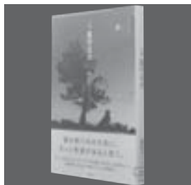
小説「星守る犬」 原田マハ 著